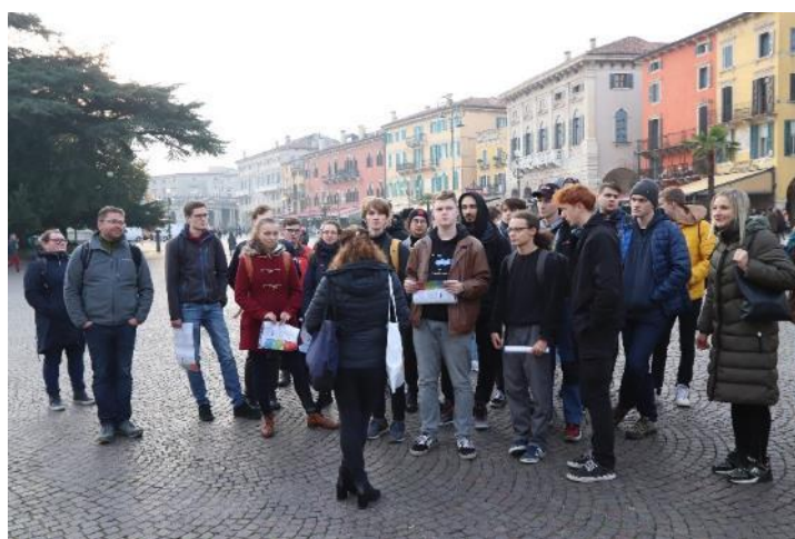
Obrázek 3 a 4: Žáci jihočeských škol na prohlídce Verony a místních škol a institucí.