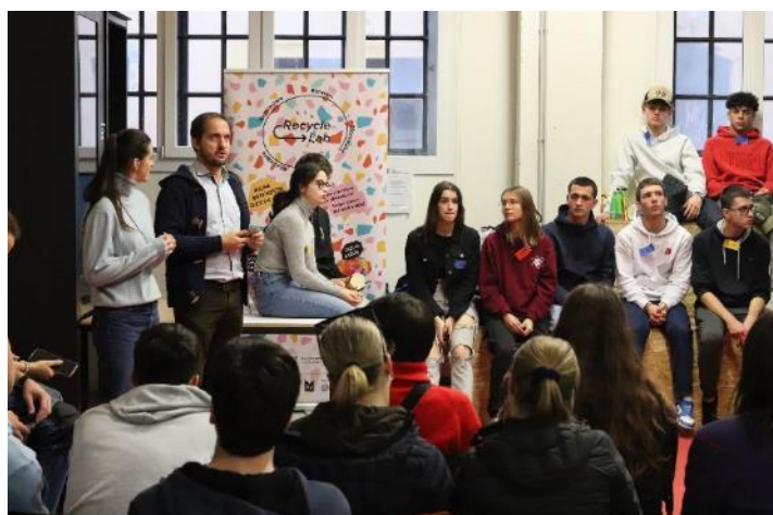
Obrázek 1 a 2: Týmové aktivity žáků z jednotlivých evropských států během týdenní stáže ve Veroně.